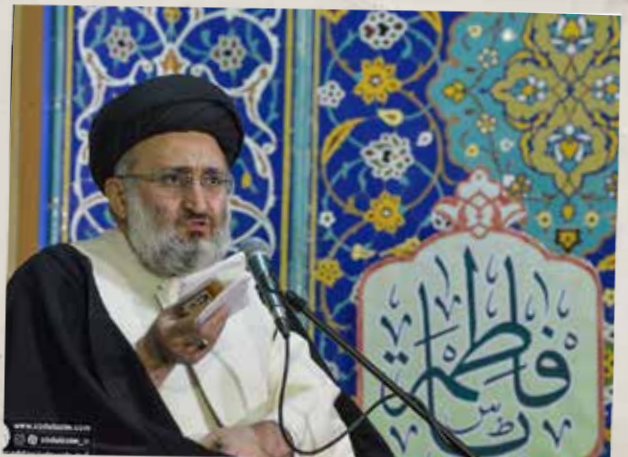
مراسم ولادت حضرت جواد(ع) بخش از شبکه دو