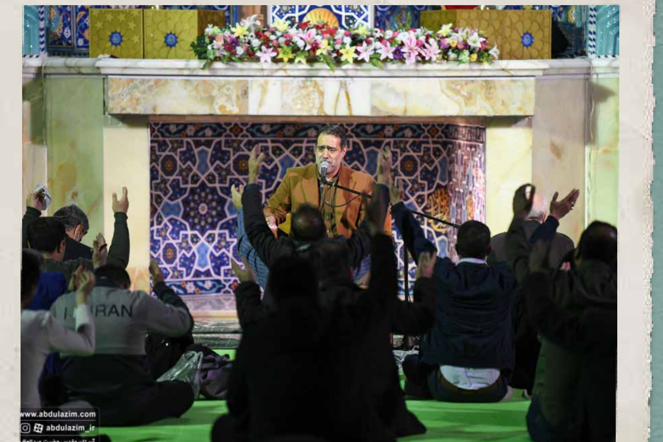
ویژه برنامه لیله الرغائب