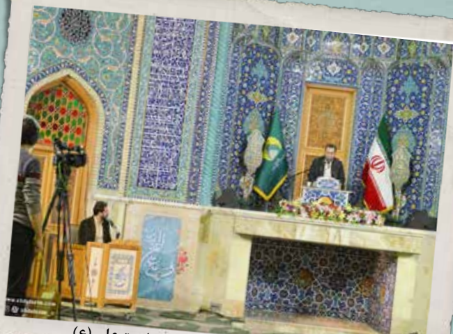
بخش زنده محفل انس با قرآن کریم در شام ولادت حضرت علی (ع)