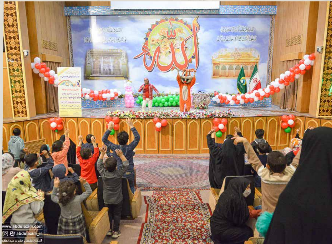
جشن کودکانه در روز ولادت حضرت فاطمه زهرا(س)