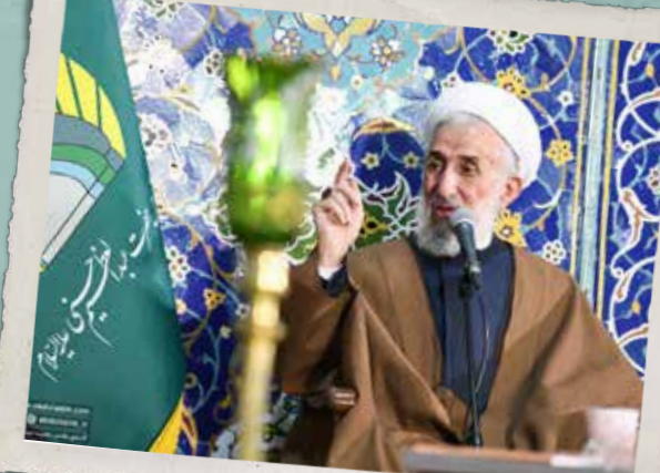
بخش زنده دعای سمات