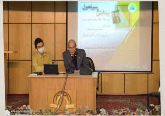
کارگاه پیدایش و سیر و تحول دوره ۱۲۸ ساله در تقویم هجری شمسی