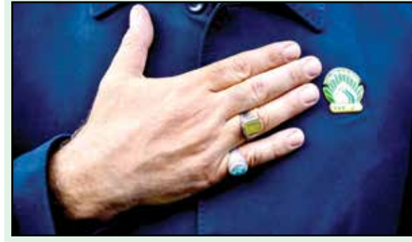
■ وظایف رفتاری خادم

حفظ حرمت صاحب حرم حرم‌های مطهر امامان معصوم (ع)، مانند خانه و مرقد پیامبر هستند که خدا درباره آن فرموده: «لا ترفعوا اصواتکم فوق صوت النبی» صدای خود را از صدای پیامبر بالاتر نبرید از آنجاکه امامان معصوم (ع)، اوصیا و پاره‌های تن پیامبر اکرم (ص) هستند، حکمی که درباره آن حضرت است، درباره ایشان نیز جاری است. آن عزیزان خدا، حاضر و ناظرند؛ بنابراین نباید در حضورشان صدا را بلند کرد. این کار و کلاه عملی که بی‌احترامی به شأن صاحب حرم باشد مردود است. در میان عامه ضرب المثل است که «حرمت امامزاده را متولی باید حفظ کند». ترک سخنان عبث از دیگر وظایف خادم است. خادم در این حرم‌های مطهر در محضر امامان معصوم قرار دارد؛ بنابراین باید نهایت احترام را رعایت کند؛ پرداختن به سخنان بیهوده نیز نوعی بی‌احترامی است که باید ترک شود.