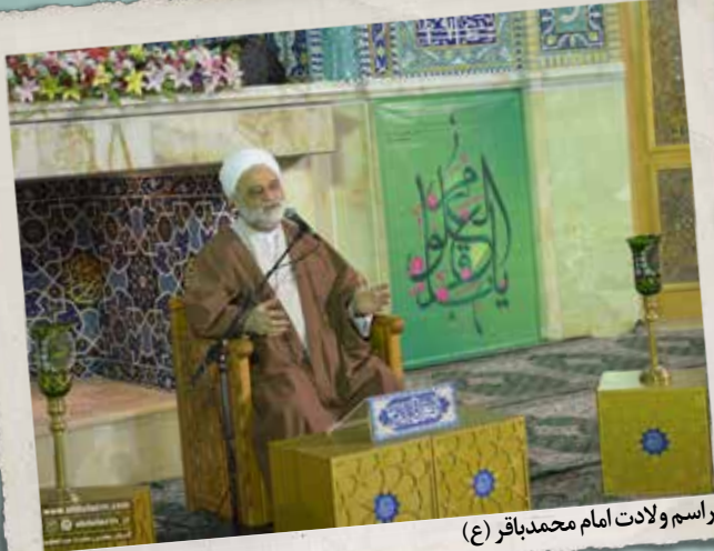
مراسم ولادت امام محمدباقر (ع)