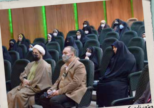
ویژه برنامه یک روز خوب با حضور پرسنل آستان مقدس و خانواده های ایشان