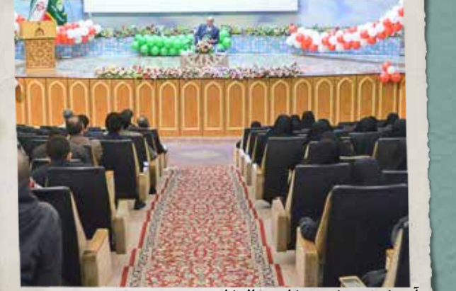
آموزش ضمن خدمت خادمین افتخاری