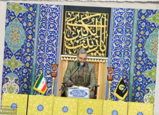
بخش زنده ویژه برنامه اعمال ام داود از شبکه قرآن سیما