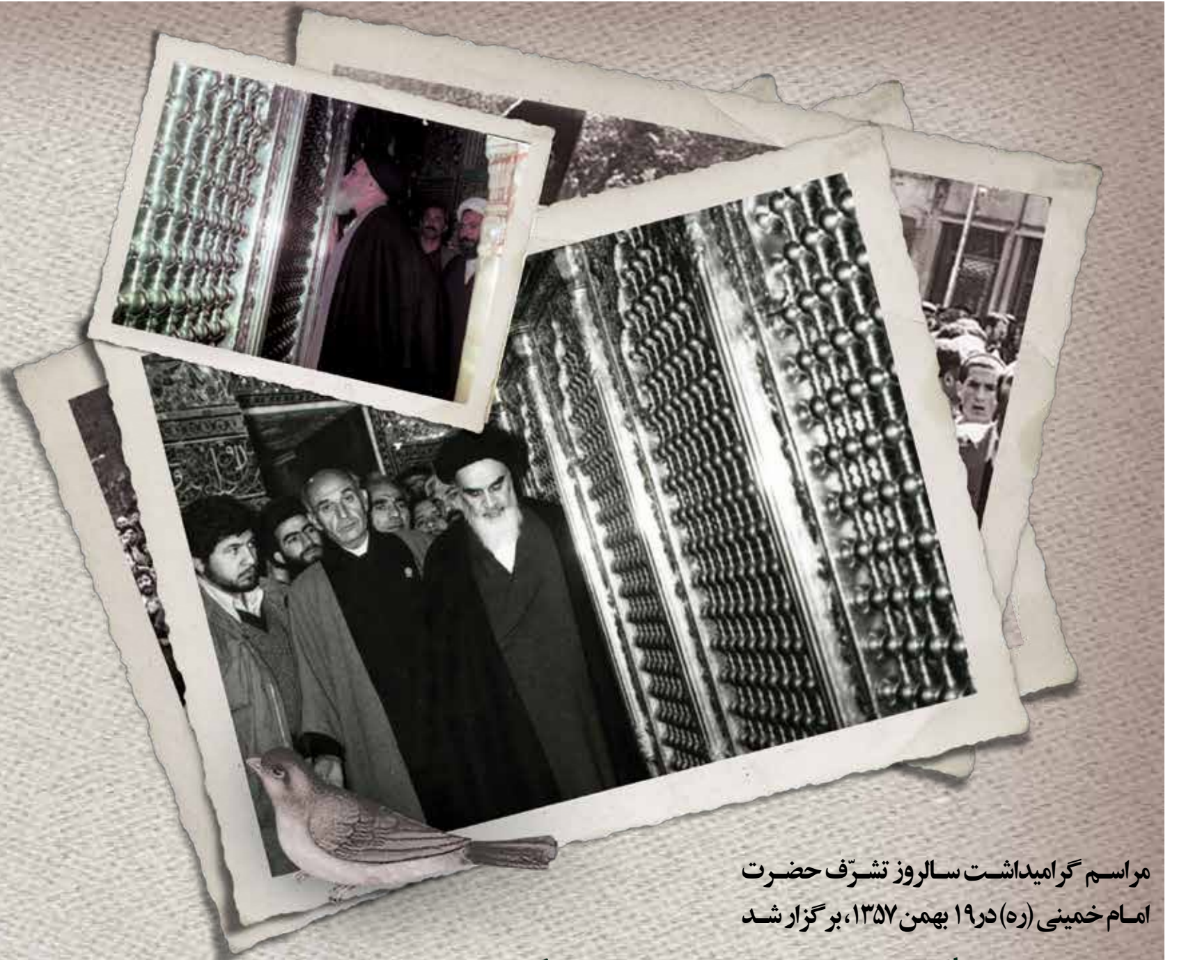
مراسم گرامیداشت سالروز تشرّف حضرت امام خمینی (ره) در ۱۹ بهمن ۱۳۵۷، برگزار شد