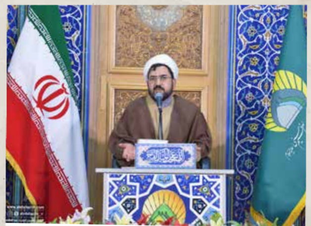
مراسم شب میلاد حضرت امام جواد(ع)