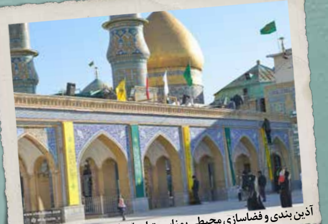
آدین بندی و فضای سازی محیطی بمناسبت اعیاد ماه رجب