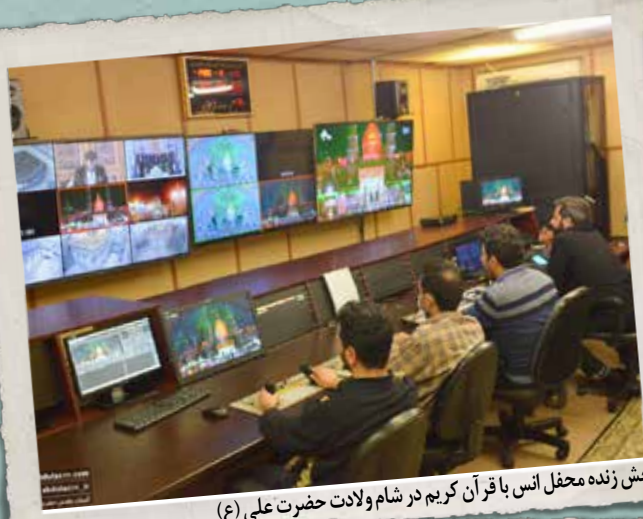
بخش زنده محفل انس با قرآن کریم در شام ولادت حضرت علی (ع)