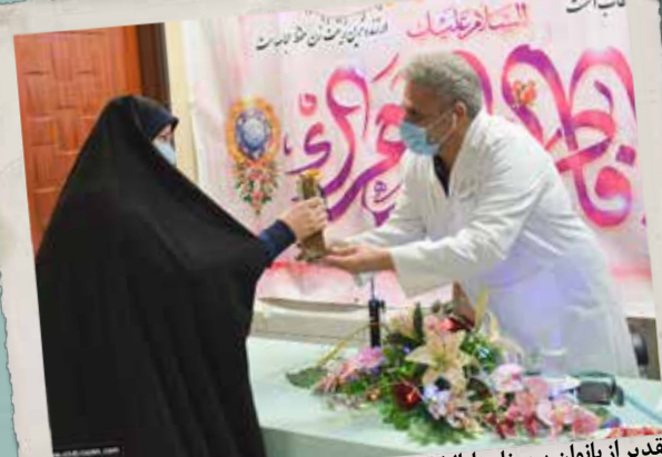
تقدیر از بانوان پرسنل دارالشفاء کوثر در روز ولادت حضرت زهرا(س)